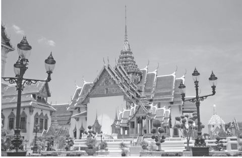
วัดราชโอรสารามราชวรวิหาร เขตจอมทอง กรุงเทพฯ

จากภาพ ลักษณะที่สามารถเห็นได้อย่างเด่นชัดของวัดราชโอรสารามราชวรวิหารคือข้อใด