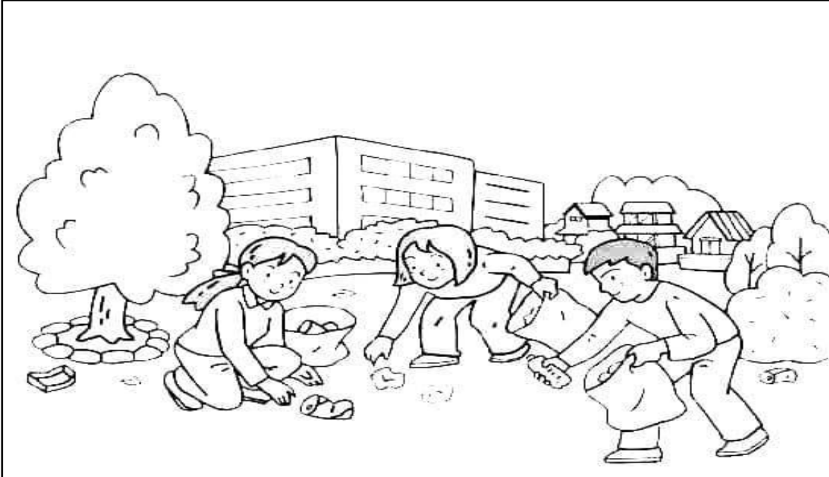
“บ้านเมืองสะอาด ปราศจากขยะ”

40. ให้นักเรียนเขียนเรียงความในส่วนของเนื้อหาโดยใช้ภาษาเชิงพรรณนาจากภาพที่กำหนดให้ในเรื่อง “บ้านเมืองสะอาด ปราศจากขยะ” ความยาวไม่น้อยกว่า 3 บรรทัด